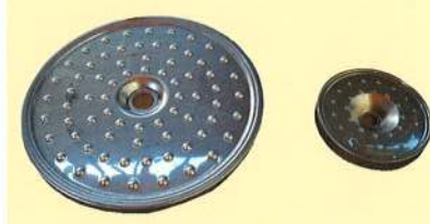
フィルタープレート