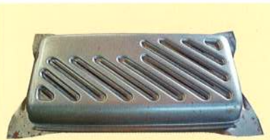
ラジエーターグリル