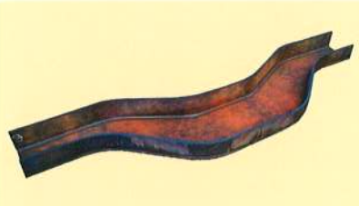
公鉄用モノカタイプ側バリ