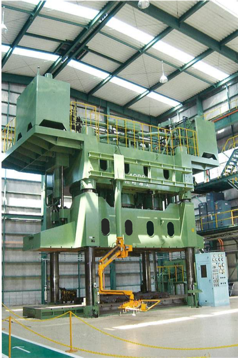
4000 ton ダイクッションプレス